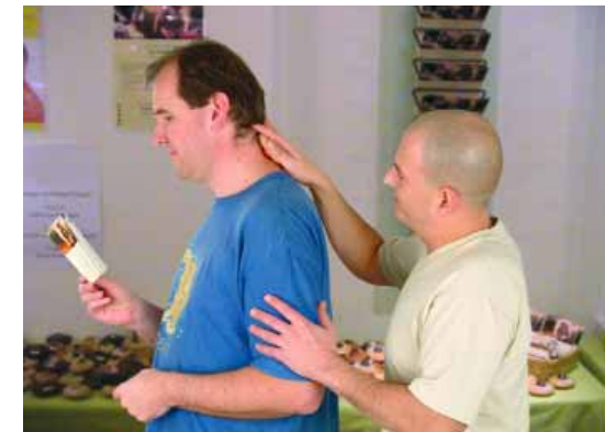
Erste Begegnung: Die Autoren beim Test des Joya ® Massagerollers

Im Internet finden Sie mehr zu Ulrich Metz und dem Joya ® unter www.joya-online.de