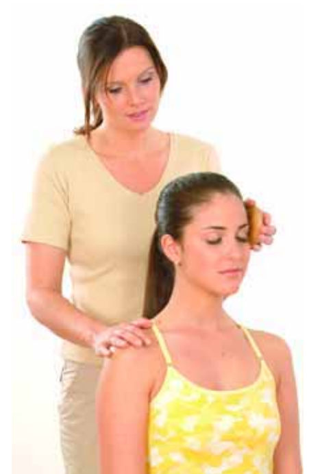
Der Joya® Massageroller im Einsatz